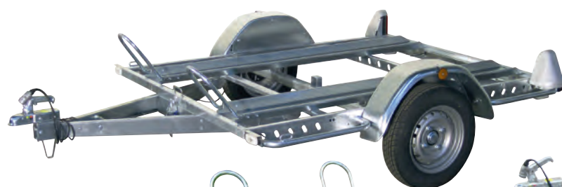
Option rails porte-motos + rampe de montée

Les rails s'emboîtent dans la traverse du châssis et se verrouillent d'un simple clic.