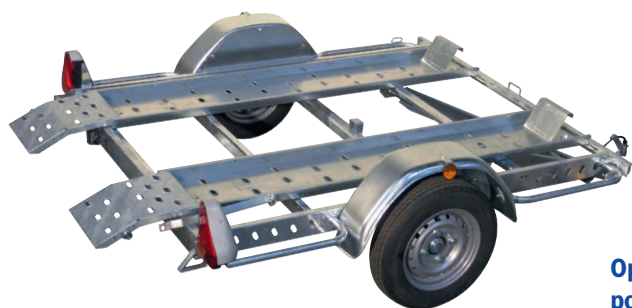
Option rails + options rampes + porte quads

Tous les accessoires sont montables et démontables sans outil