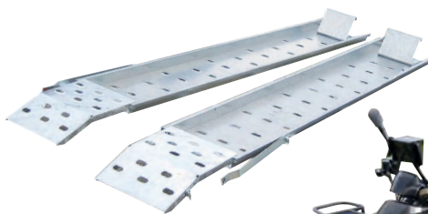
Option rails pour quads + option rampes de montée