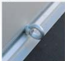
■ Anneaux d'arrimage supplémentaires