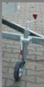
■ Roue Jockey à bride (ø = 48mm)