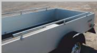
■ Rambardes (2m)