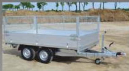
■ Rehausses grillagées