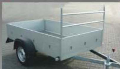
■ Porte échelle