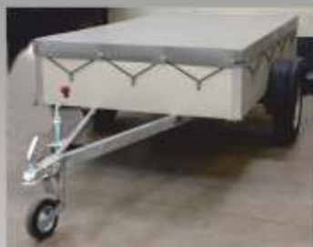
■ Bâche plate