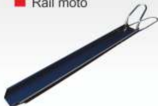
■ Rail moto